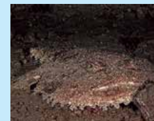
17/O - rana pescatrice

Le attività dell'uomo causano la scomparsa di molte piante e animali, creando ambienti alterati, innaturali che sono biologicamente omogenei perché dominati da un numero ridotto di specie resistenti. Gli ambienti inalterati, naturali presentano invece un elevato grado di biodiversità perché in essi vivono molte specie vegetali e animali in equilibrio ecologico. Compilando questa scheda di rilevamento dopo la tua immersione, ci aiuterai a stimare la biodiversità dell'ambiente in cui ti sei immerso, permettendoci di valutare il suo stato di salute. Guarda i risultati della nostra ricerca: DUEproject.org Ideazione del progetto: P. Neri, C. Piccinetti, F. Zaccanti, S. Goffredo Fotografo ufficiale: F. Sesso Foto 2/A: Esculapio Foto in copertina: J.M. Mille Realizzazione grafica: Lauri Projects