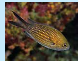
17/M - castagnola