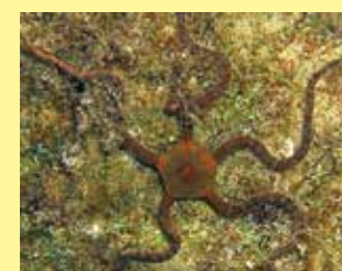
14/A - stella serpentina liscia