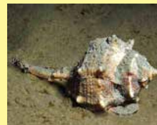
6/B - murice spinoso