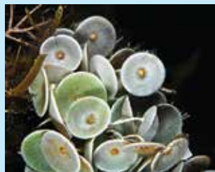
1/A - ombrellino di mare