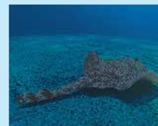
17/B - razza chiodata