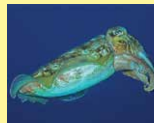
8/B - seppia