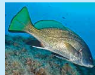
17/I - corvina