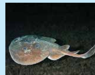
17/A - torpedine ocellata