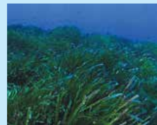
1/C - posidonia