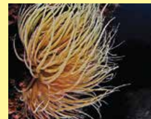
4/A - anemone di mare