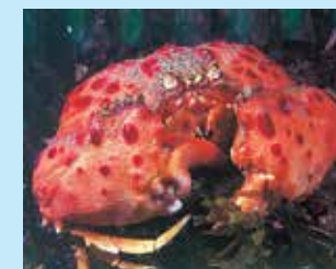
9/D - granchio melograno