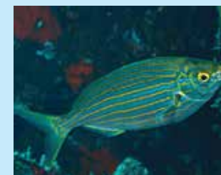
17/L - salpa