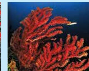
3/B - gorgonia rossa