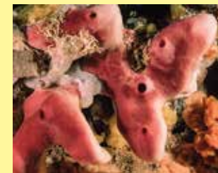
2/B - petrosia