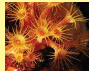
4/B - margherita di mare