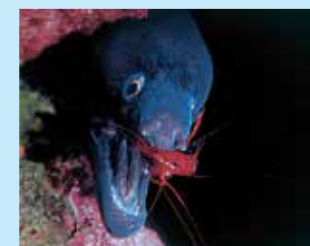
17/C - murena