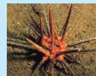
15/A - riccio saetta