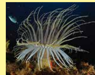
4/C - ceriario