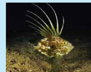
17/D - pesce San Pietro