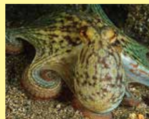
8/A - polpo comune