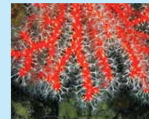
3/A - corallo rosso