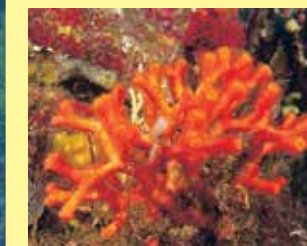
10/A - falso corallo