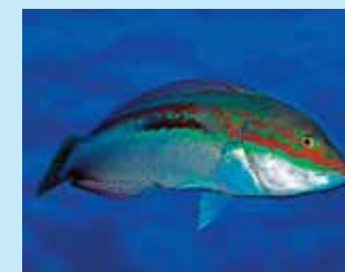
17/N - donzella