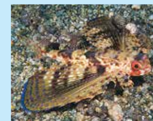
17/G - pesce civetta