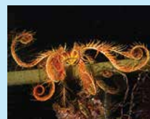
11/A - giglio di mare