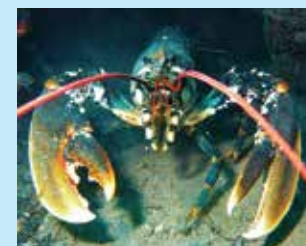
9/A - astice