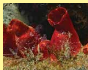
16/A - patata di mare