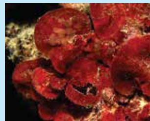
1/B - rosa di mare