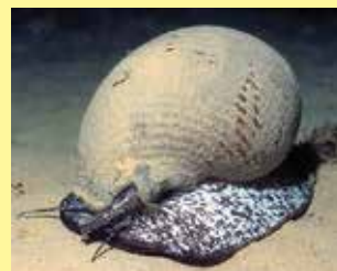
6/A - doglio