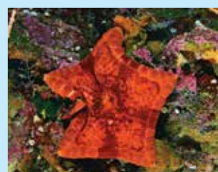
13/A - stella pentagono