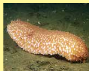
12/A - lingua di mare