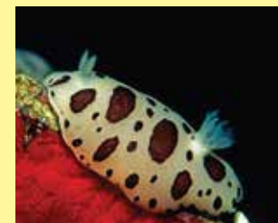
6/C - vacchetta di mare