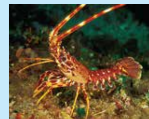
9/B - aragosta