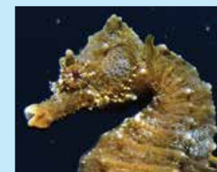
17/F - cavalluccio camuso