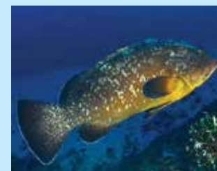
17/H - cernia bruna