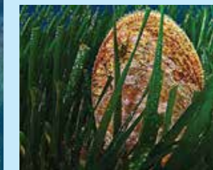
7/A - pinna