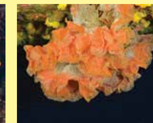
10/B - trina di mare