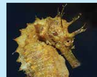
17/E - cavalluccio ramuloso