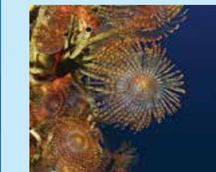
5/A - spirografo