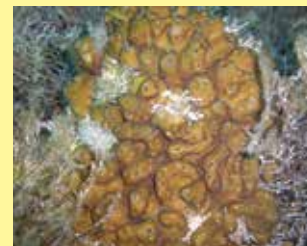
2/A - condrilla