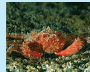
9/C - granceola